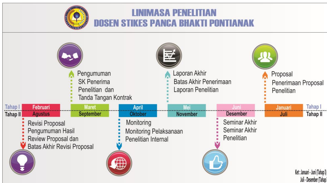
Gambar 2. Linimasa Penelitian Dosen

Sistematika usulan penelitian dosen dilakukan 1 kali dalam setahun yaitu tahap pertama bulan Januari – Juni dan tahap kedua pada bulan Juli – Desember, dimana jadwal dosen meneliti ditentukan oleh LPPM. Berikut gambar tahap penelitian dosen di STIKes Panca Bhakti Pontianak