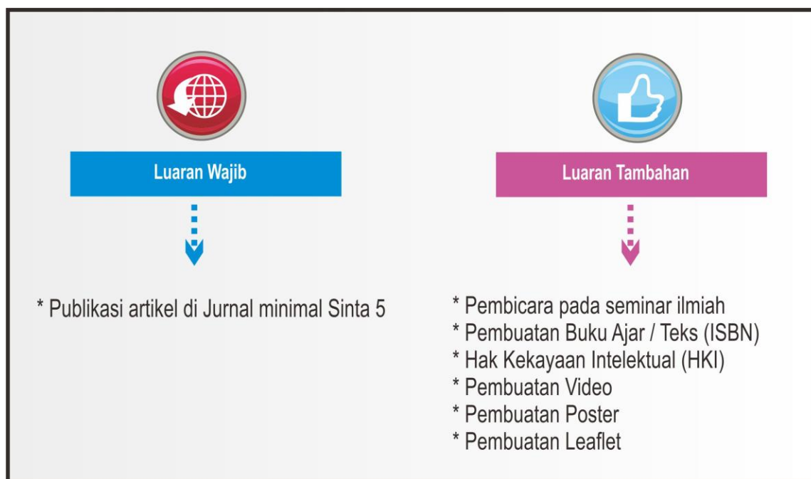
Gambar 1. Jenis Luaran Penelitian

Hasil penelitian dosen pemula diharapkan dan diutamakan memberikan kontribusi pada salah satu jenis luaran sesuai dengan Indikator Kinerja Utama Penelitian dan minimal menjadi bahan ajar pada mata kuliah pokok dosen pengusul. Jenis luaran dapat dilihat pada gambar berikut :